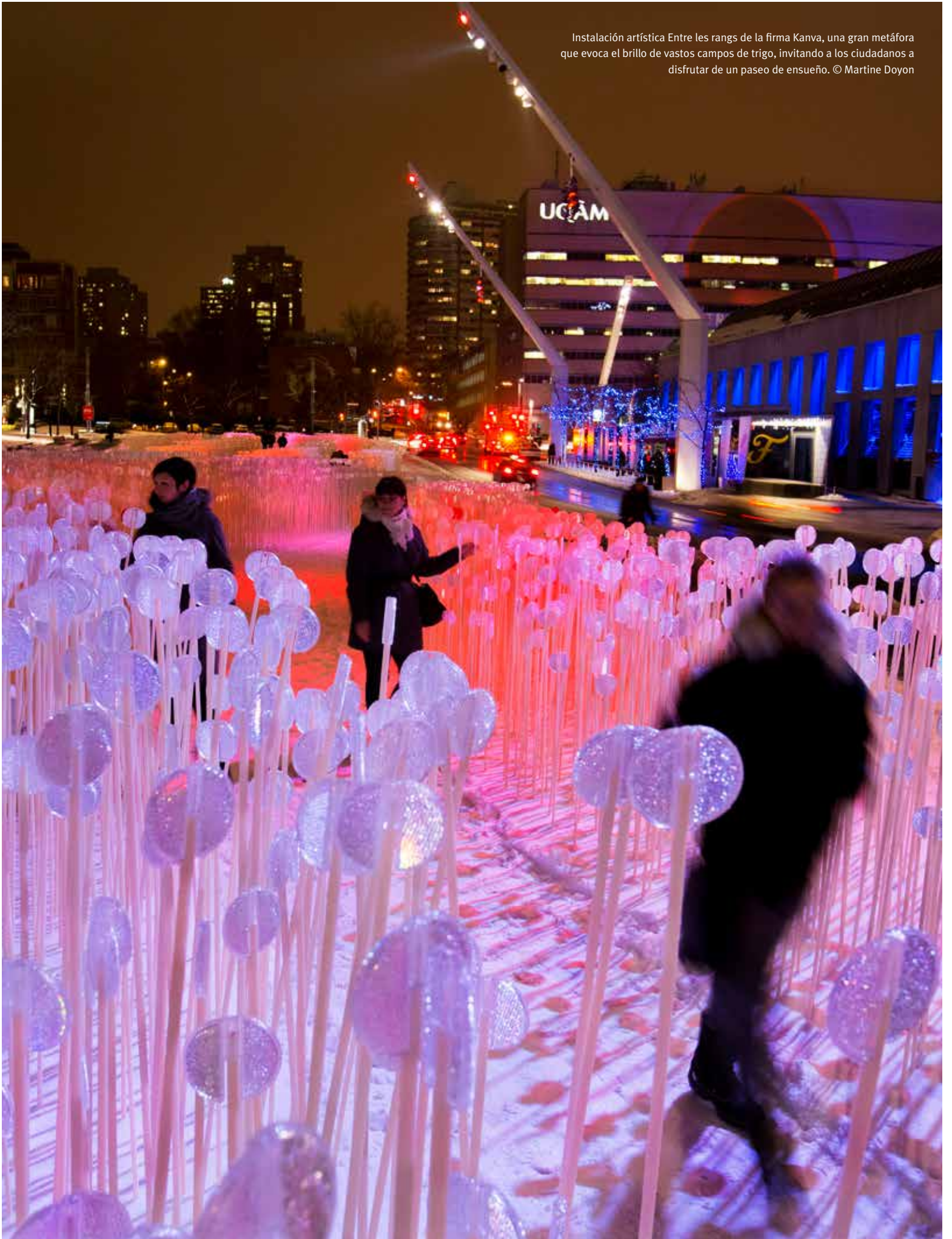
Instalación artística Entre los rangs de la firma Kanva, una gran metáfora que evoca el brillo de vastos campos de trigo, invitando a los ciudadanos a disfrutar de un paseo de ensueño.