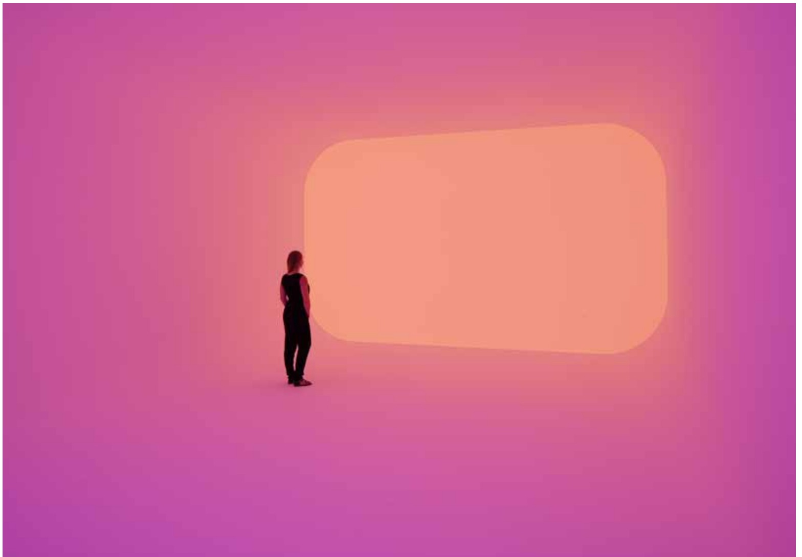
James Turrell, Ganzfeld Apani, Museum Frieder Burda, 2018

Tecnologues (S.A.T.) de Montreal que fomenta la residencia de diferentes tipologías de artistas para estimular la generación de nuevas propuestas.