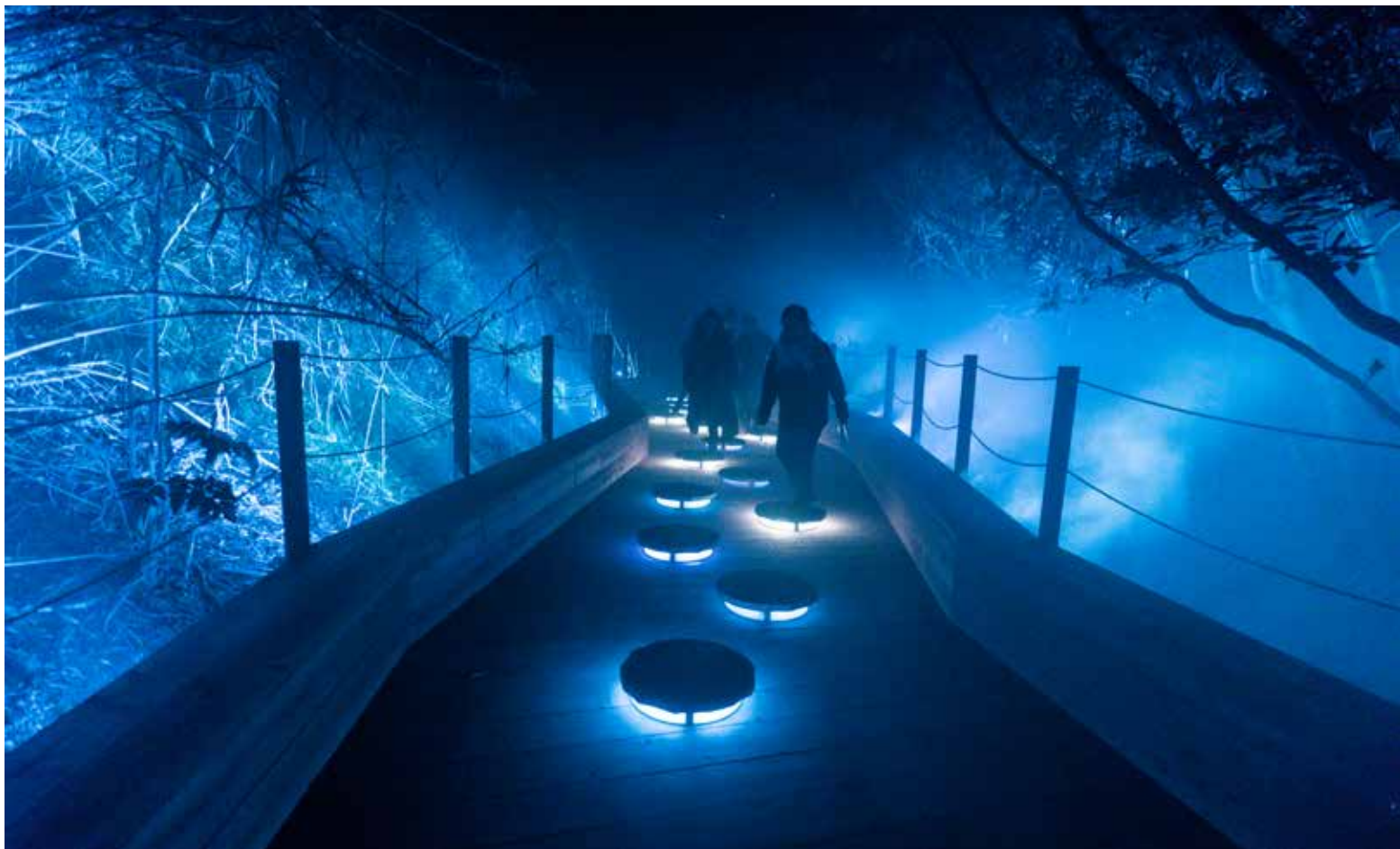
Experiencia multimedia nocturna Island Lumina