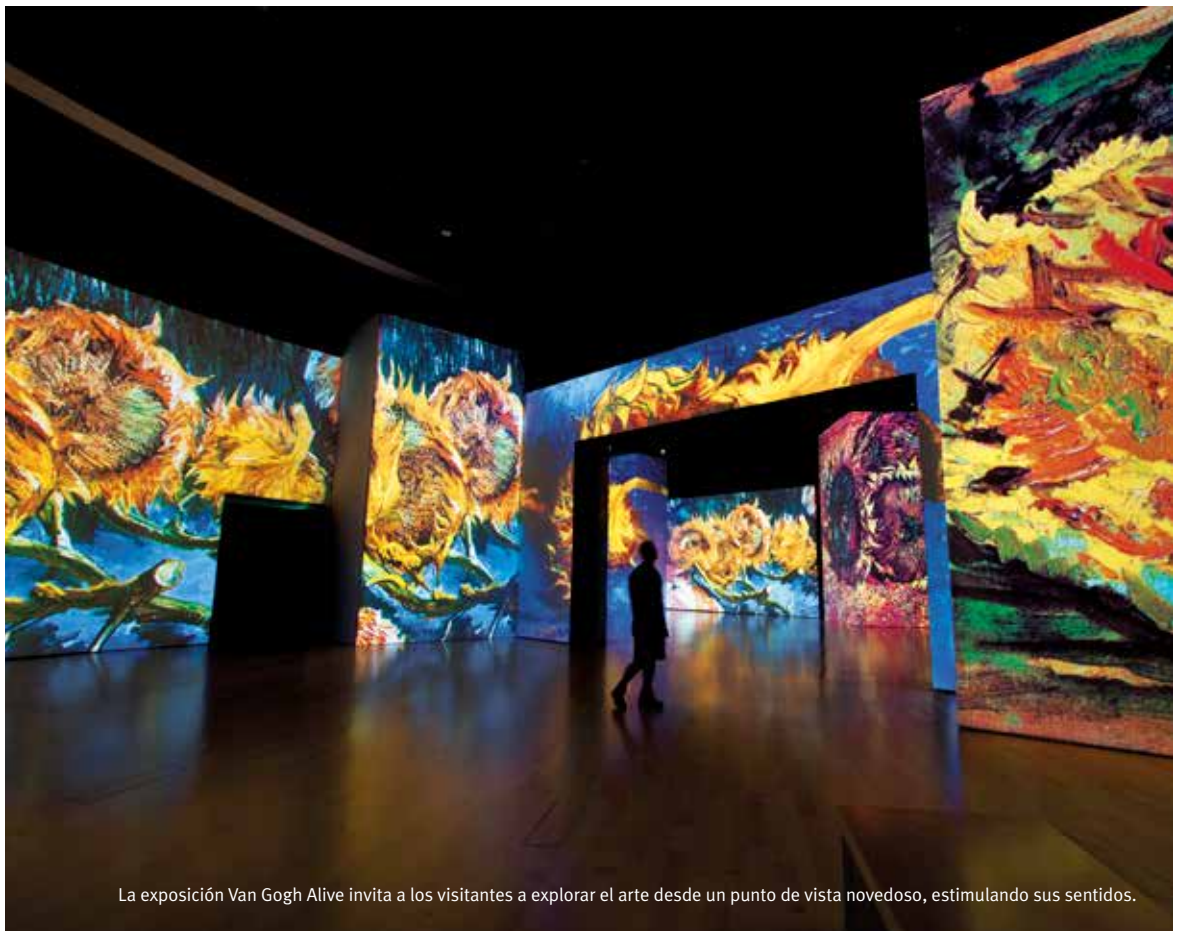
La exposición Van Gogh Alive invita a los visitantes a explorar el arte desde un punto de vista novedoso, estimulando sus sentidos.