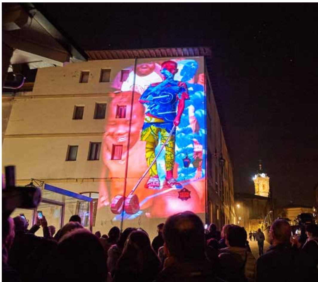
Los grandes espectáculos visuales de los festivales de luz atraen a numerosos visitantes. En las imágenes, instalaciones del Umbra Light Festival Vitoria Gasteiz.

de una colaboración entre administraciones y empresas privadas, que se celebran normalmente en calles y plazas del espacio público. Sus objetivos son diversos, pero la mayoría buscan estimular la actividad social durante los días más fríos y oscuros del año, animando a la gente a salir durante un período de tiempo que suele comprender un fin de semana o incluso algunos días más.