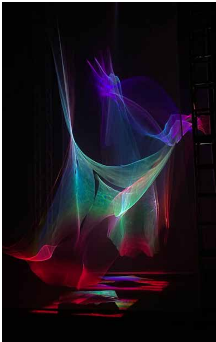
Reflexions es un concepto en constante evolución que, en función del contexto y el espacio expositivo, cobra vida de una determinada manera, adaptándose a diversas realidades, entornos y culturas.

cepto central de proyecto: dejar de trabajar la luz como fuente y apreciarla cuando se deshace, cuando nace, cuando se transforma en reflejo. De alguna manera sentir que se nos escapa, que muta y que se transforma en alguna cosa casi animada. Hemos dejado que nos atrapara y hemos experimentado hasta el final”.